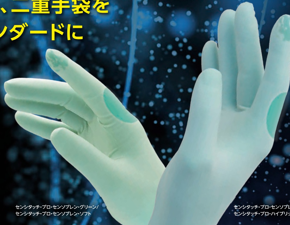
センシタッチ・プロ・センソプレん・グリーン/ センシタッチ・プロ・センソプレん・ソフト

二重手袋の際、インナーとアウターの色を分けることが推奨されています。特にインナーに濃い色、アウターに薄い色の手術用手袋を装着することで破損やピンホールが視覚的に分かりやすくなります。